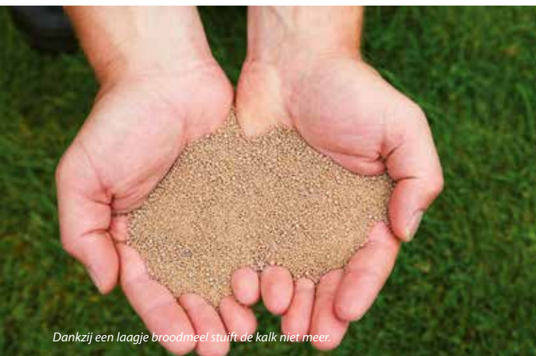
Dankzij een laagje broodmeel stuift de kalk niet meer.